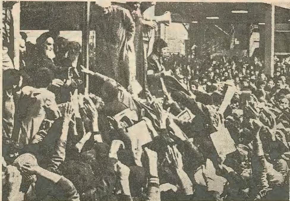
Ο Αγιατολλάχ Χομείνι προσφέρει το χέρι του σ' έναν Πέρση στρατιώτη με στολή που ήθελε να τον χαιρετήσει μαζί με δεκάδες χιλιάδες άτομα, που συγκεντρώθηκαν χτές γύρω από το σπίτι που μένει ο θρησκευτικός ηγέτης για να τον επευφημίσουν.

Την ίδια στιγμή οι διάφοροι αστοί στην Κύπρο και την Ελλάδα - ή τουλάχιστον οι πιο αισιόδοξοι - ελπίζουν και περιμένουν ότι το «χάος» στην Τουρκία θα οδηγήσει σε μια θεαματική «κατάρρευση»